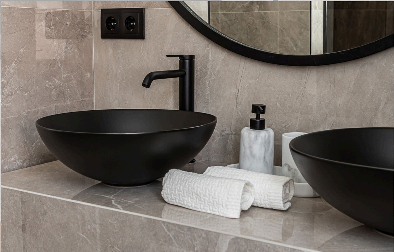
Fotos reales de inmueble con acabado similar