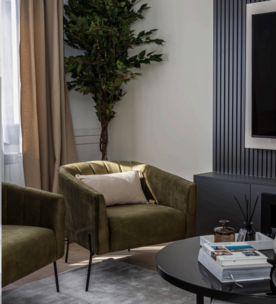
Fotos reales de inmueble con acabado similar