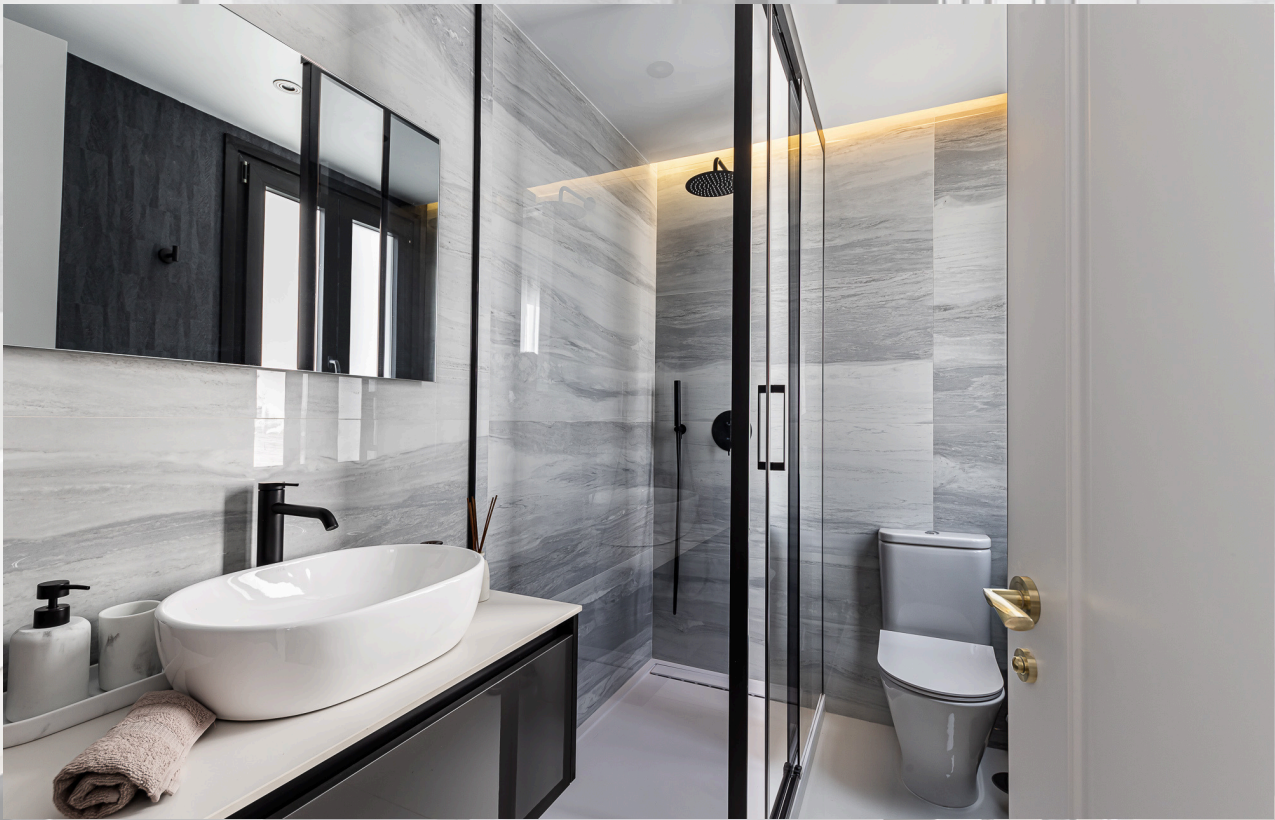
Fotos reales de inmueble con acabado similar