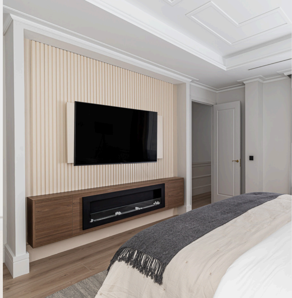
Fotos reales de inmueble con acabado similar