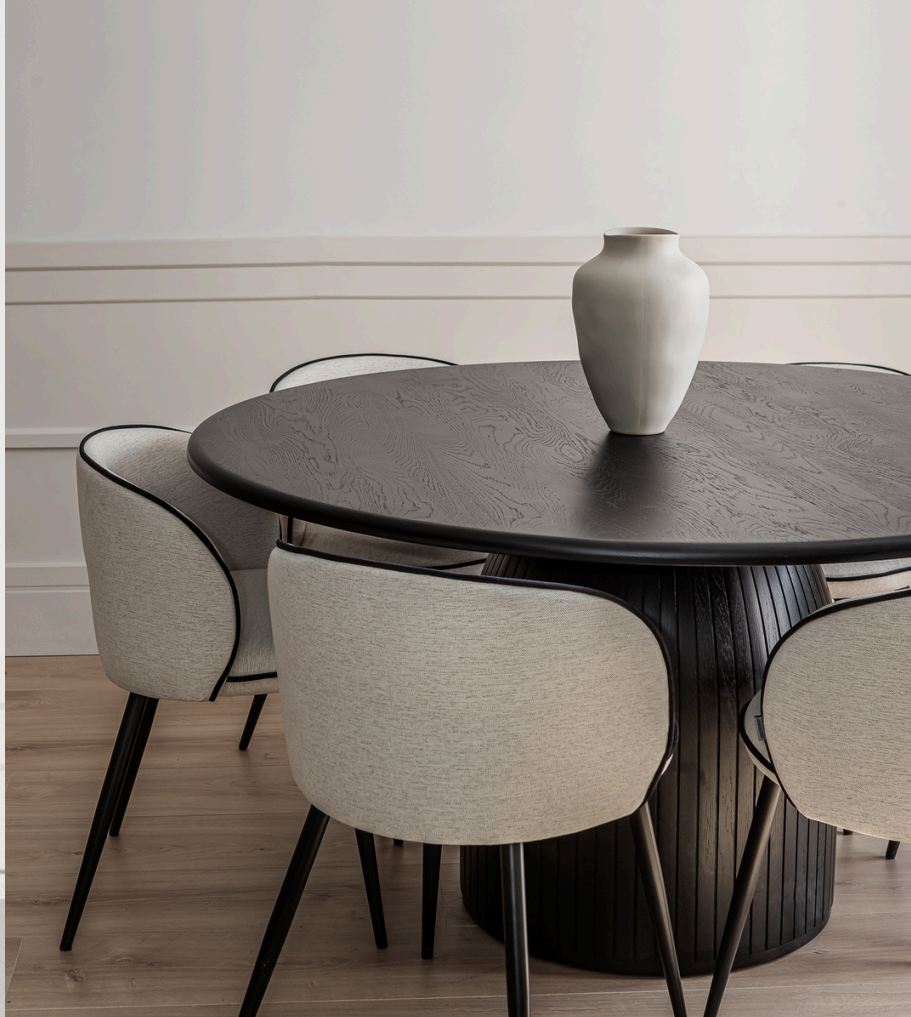
Fotos reales de inmueble con acabado similar