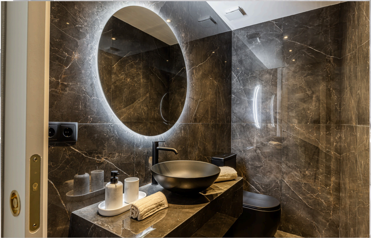
Fotos reales de inmueble con acabado similar