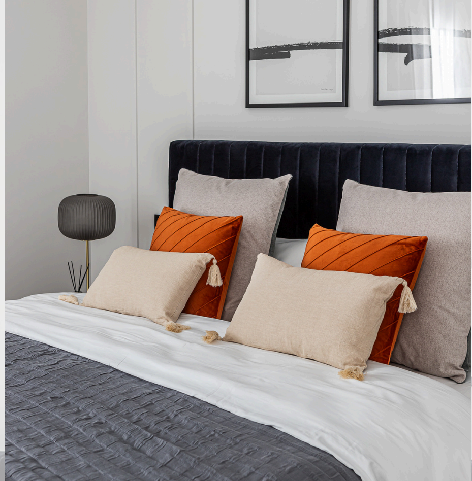
Fotos reales de inmueble con acabado similar