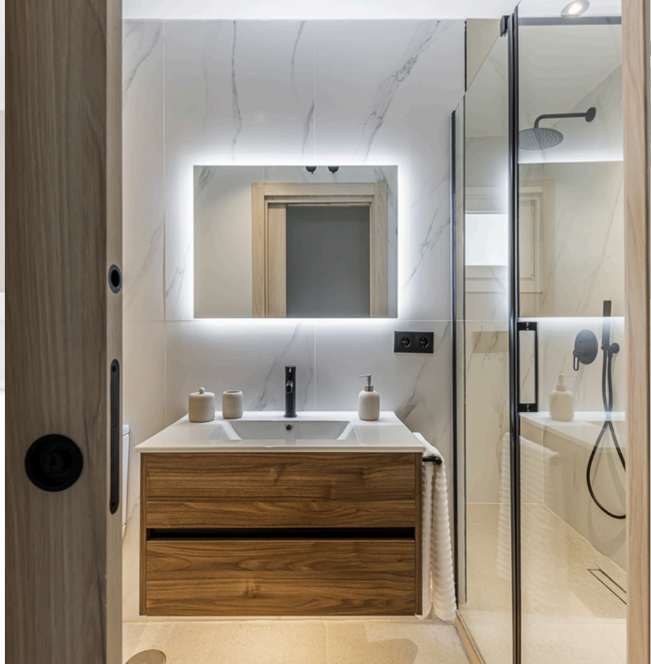
Fotos reales de inmueble con acabado similar