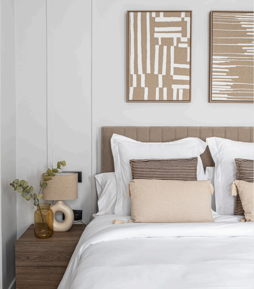
Fotos reales de inmueble con acabado similar