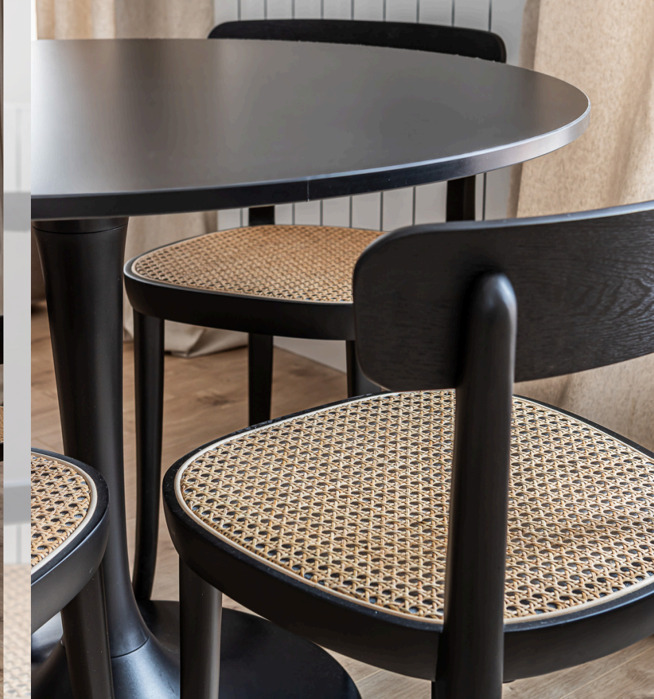
Fotos reales de inmueble con acabado similar