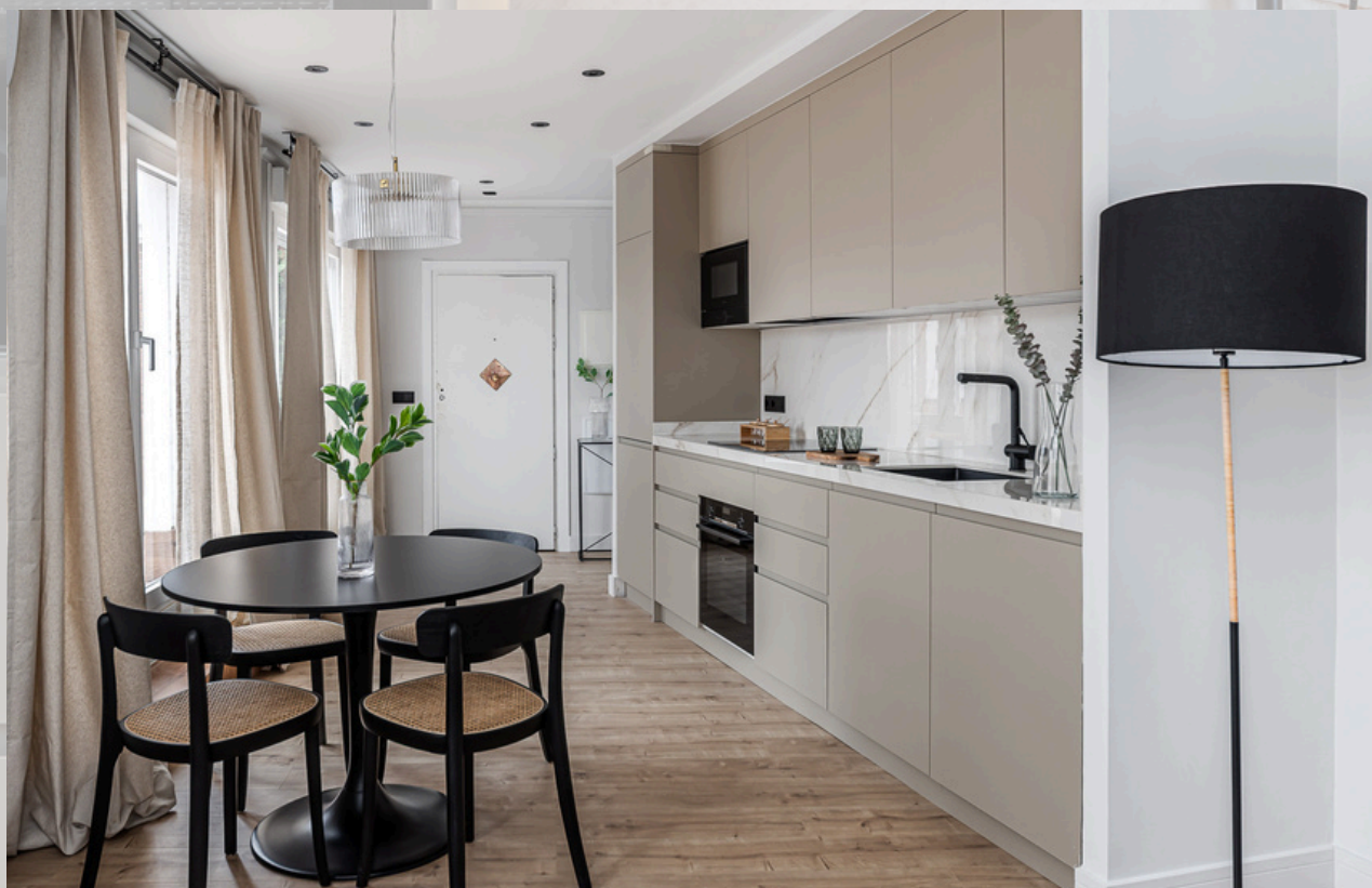
Fotos reales de inmueble con acabado similar