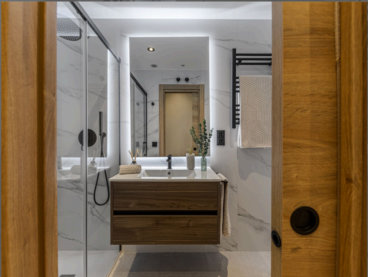
Fotos reales de inmueble con acabado similar