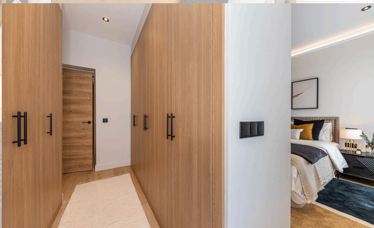
Fotos reales de inmueble con acabado similar