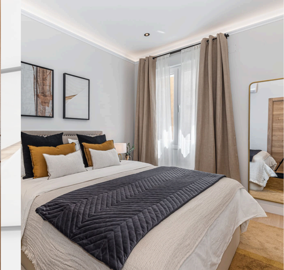
Fotos reales de inmueble con acabado similar