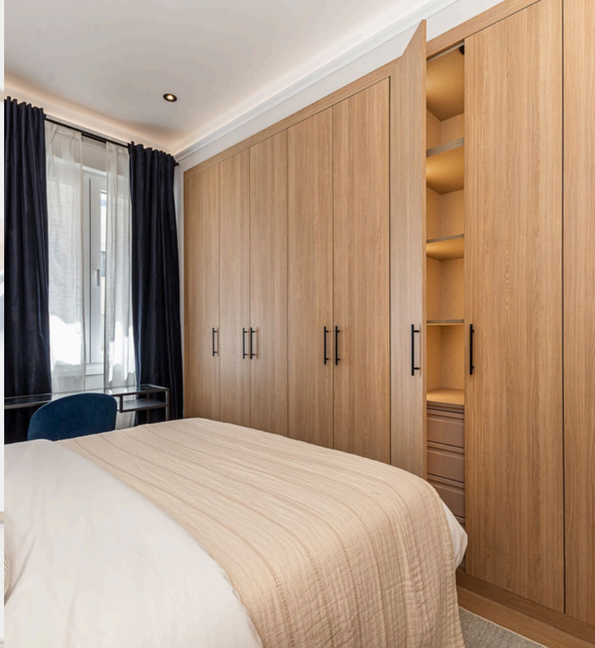
Fotos reales de inmueble con acabado similar