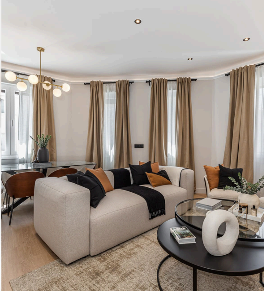
Fotos reales de inmueble con acabado similar