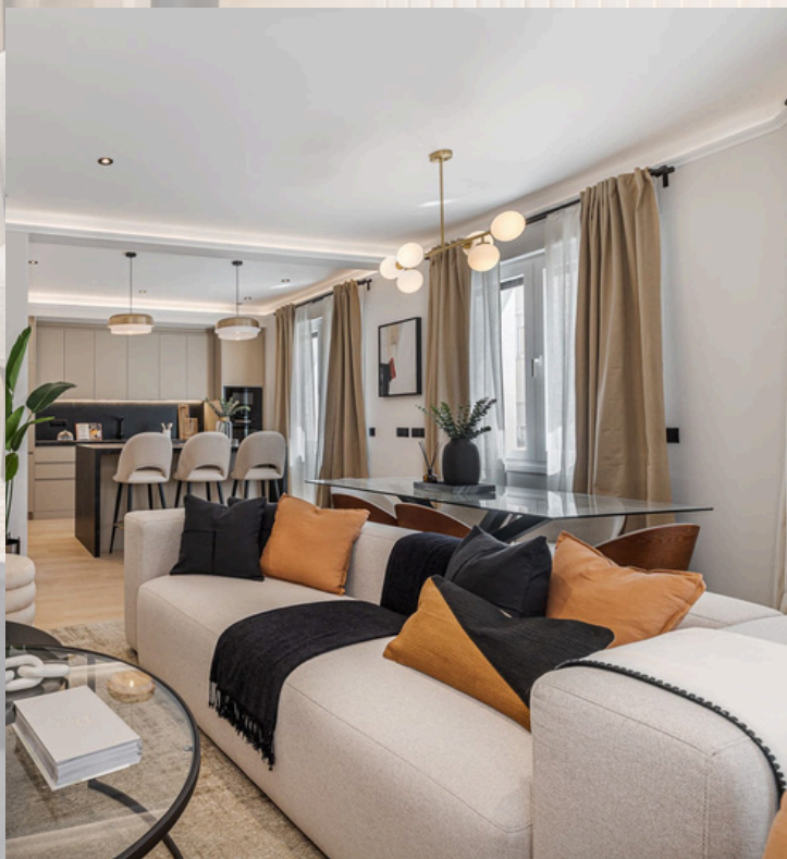
Fotos reales de inmueble con acabado similar