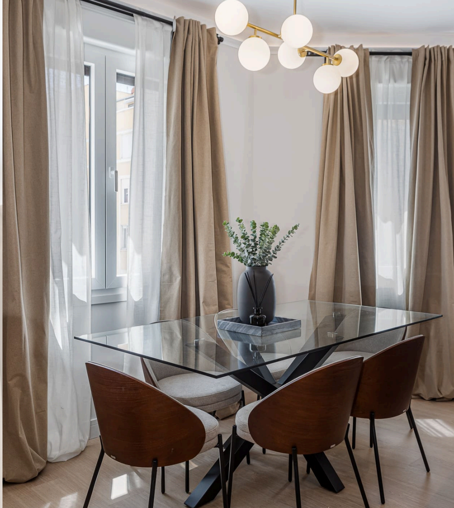
Fotos reales de inmueble con acabado similar