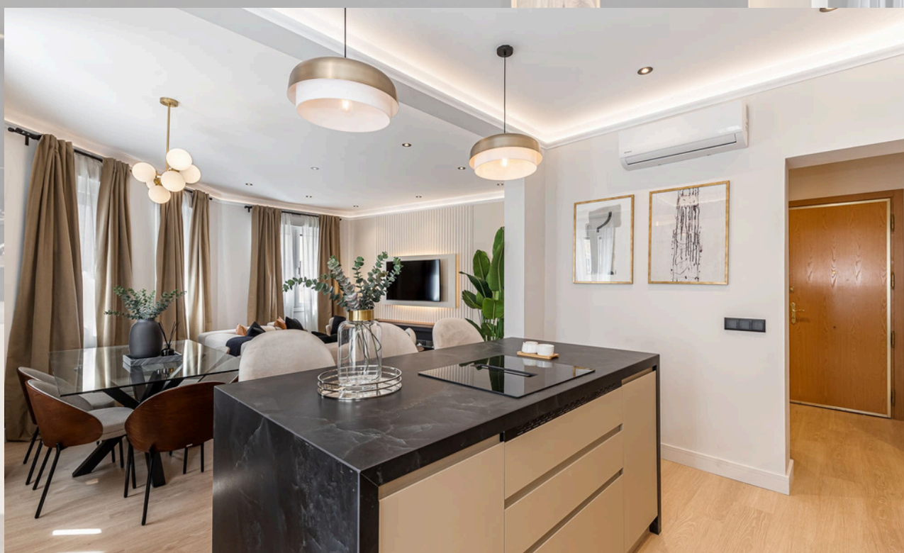
Fotos reales de inmueble con acabado similar